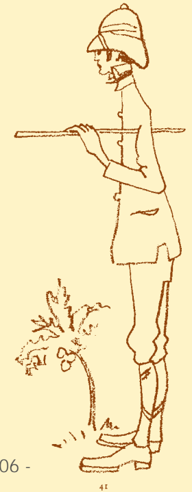
Heinrich Vogeler Im Reisekostüm - Selbstkarikatur, 1906 -