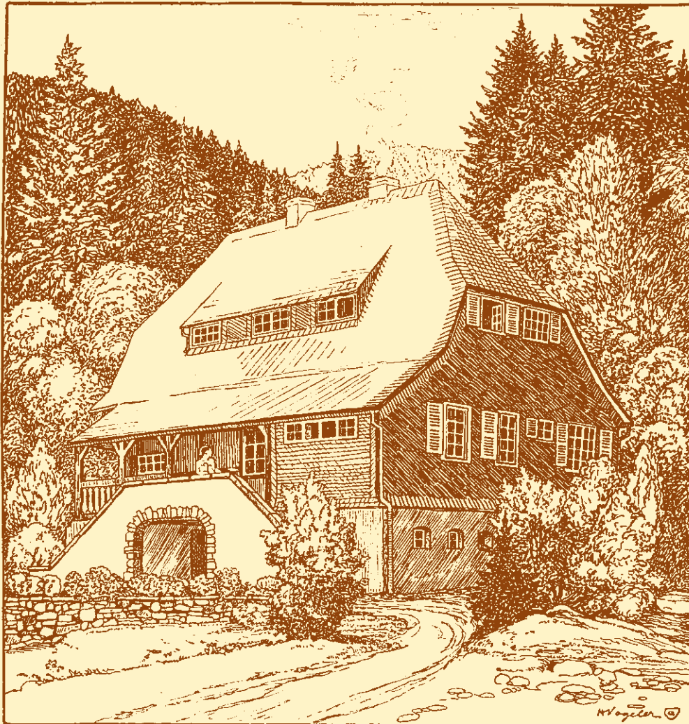
HAUS IM STRYCK . POST WILLINGEN (WALDECK) BAHNSTATION: BRILON-WALD