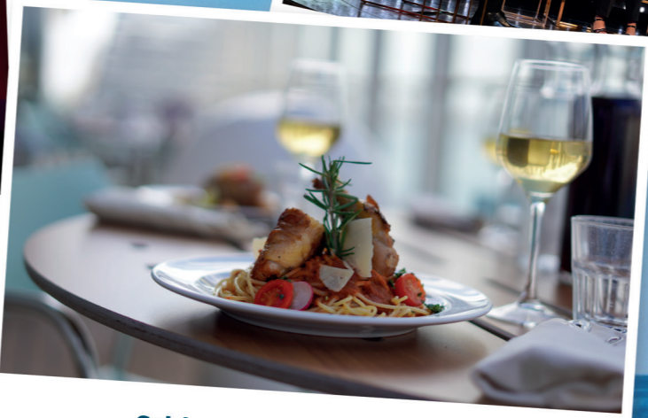
Schlemmen und genießen