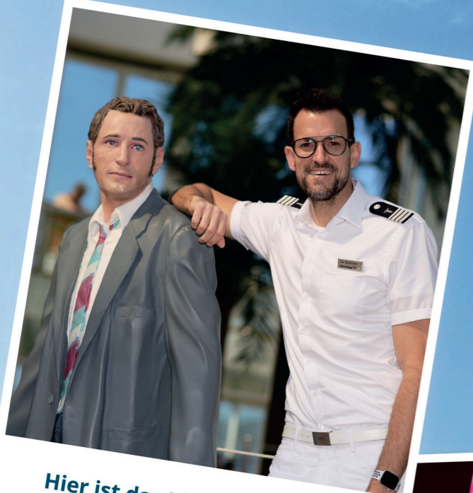
Hier ist das Lächeln zu Hause