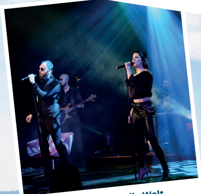
Immer da, wo die Welt am schönsten ist