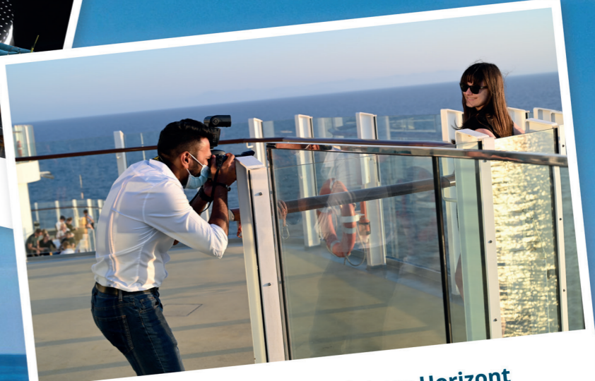
Der Alltag verschwindet am Horizont