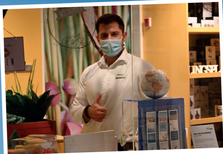
Tiefenentspannt auf hoher See