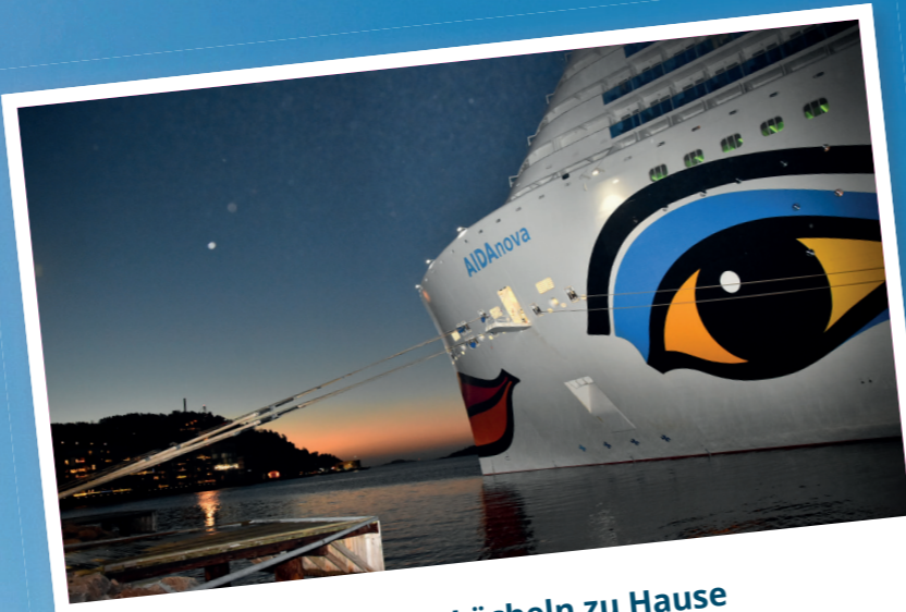
Hier ist das Lächeln zu Hause