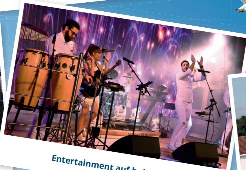
Entertainment auf hoher See