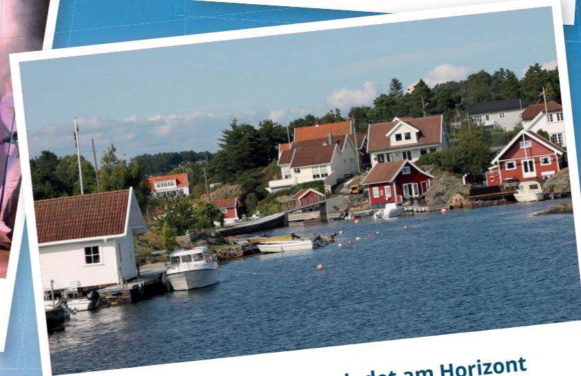
Der Alltag verschwindet am Horizont