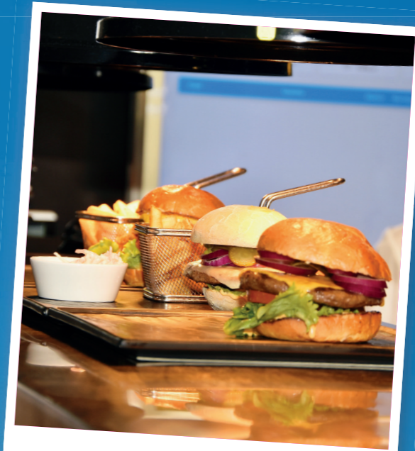
Schlemmen und Genießen