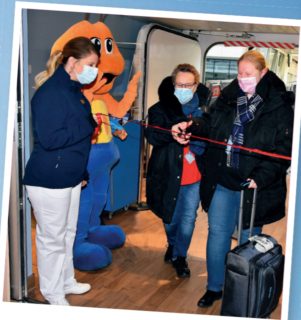
Schmetterlinge im Bauch