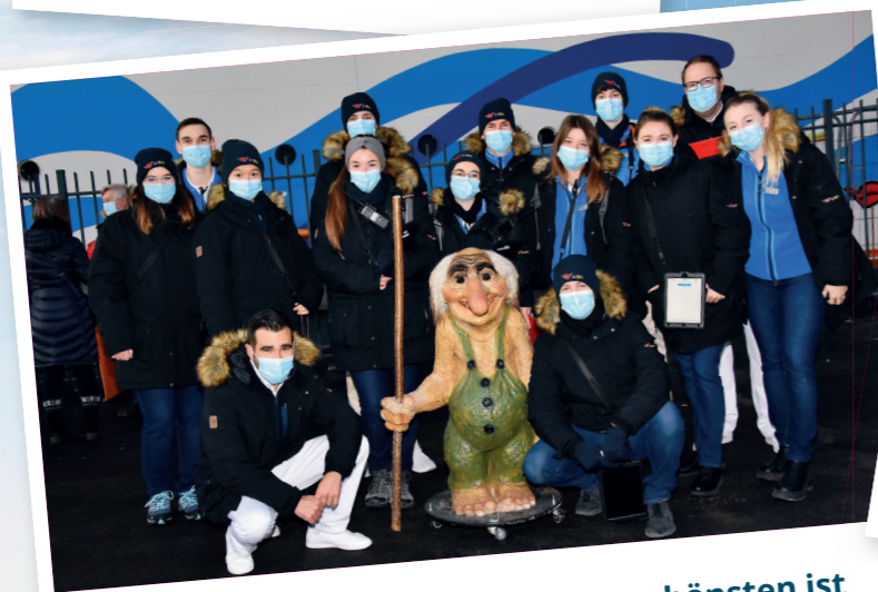
Immer da, wo die Welt am schönsten ist