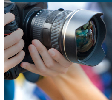
FOTO-SHOOTINGS AN BORD

An Bord von AIDAnova gibt es unzählige perfekte Kulissen für ein Foto-Shooting. Unsere professionellen Fotografen rücken Sie ins richtige Licht und halten Ihre perfekten Urlaubserinnerungen fest. Lassen Sie sich bei unserem Ocean- oder Meerblick-Porträt heute um 10:00, 11:00 und 16:00 Uhr auf den offenen Decks vor der Weite des Ozeans ganz unverbindlich ablichten und treffen Sie einfach später eine Kaufentscheidung. Treffpunkt für alle Shootings ist im Fotoshop auf Deck 6.