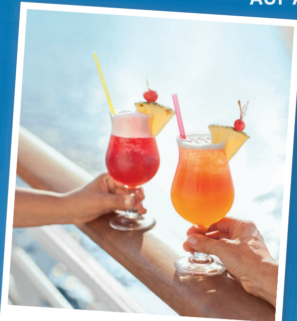
Kühle Drinks genießen