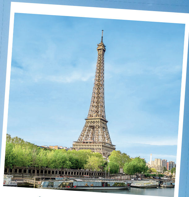
Immer da, wo die Welt am schönsten ist