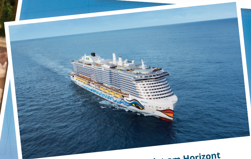
Der Alltag verschwindet am Horizont