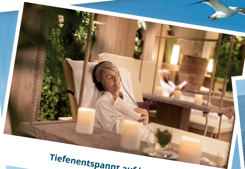
Tiefenentspannt auf hoher See