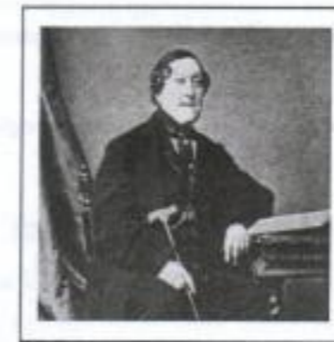
Gioacchino Rossini ( 1792 – 1868 )

Gioacchino Rossini ist der Inbegriff des kulinarischen Musikers, des musikalischen Gourmet. Vom 14. Lebensjahr an studierte er in Bologna Cello, Klavier und Kontrapunkt. 18-jährig veröffentlichte er die ersten Opern, und mit 21 Jahren begann seine triumphale Laufbahn mit den Stücken „Tancredi“, „Der Barbier von Sevilla“, „Othello“, „Die die-bische Elster“ und schließlich „Wilhelm Tell“. Es war sein letztes großes Werk, geschrieben in Paris.